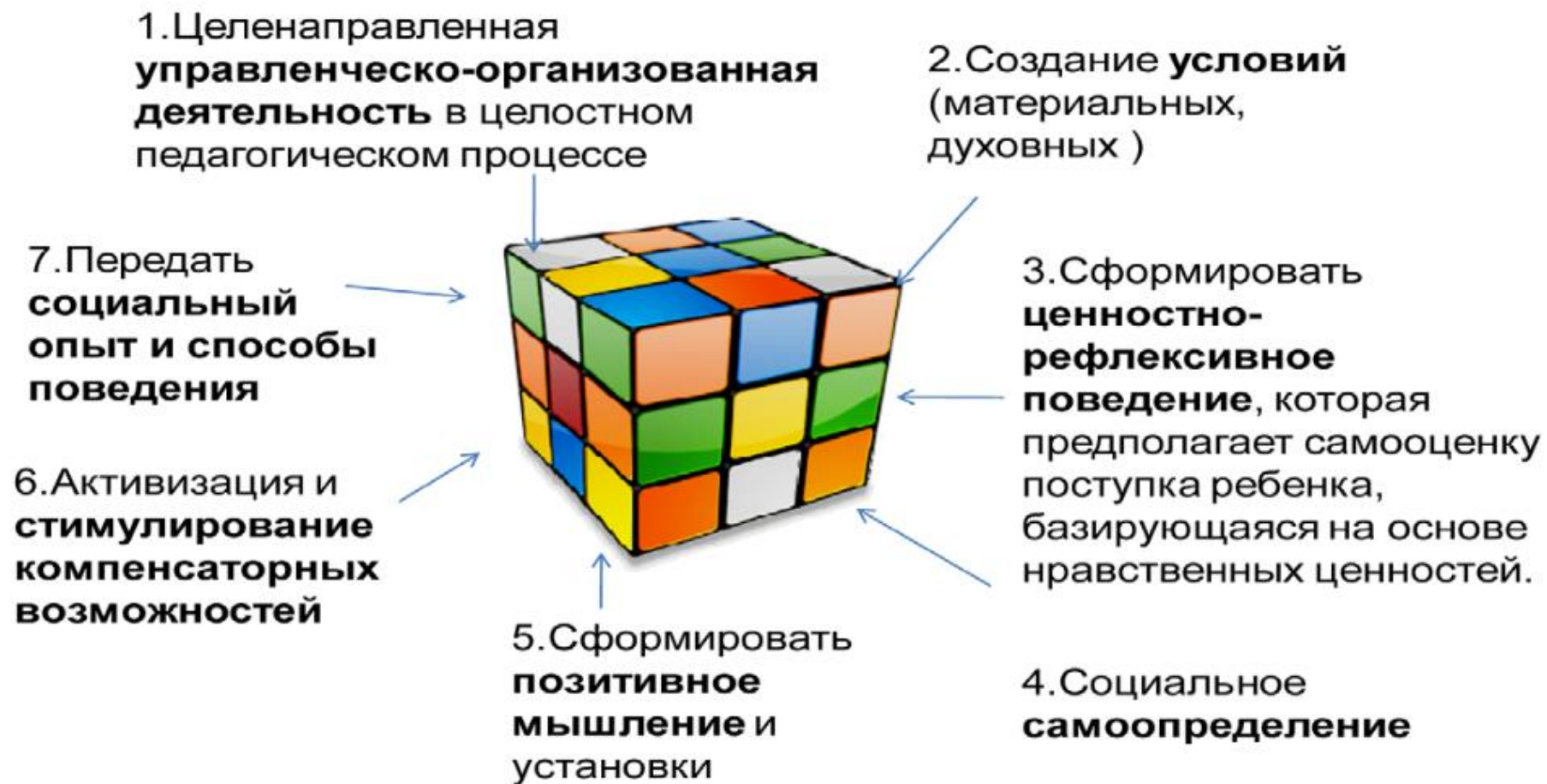
Рисунок 8 – Составляющие процесса воспитания